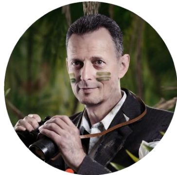
Александр Фридман Хаос-менеджмент